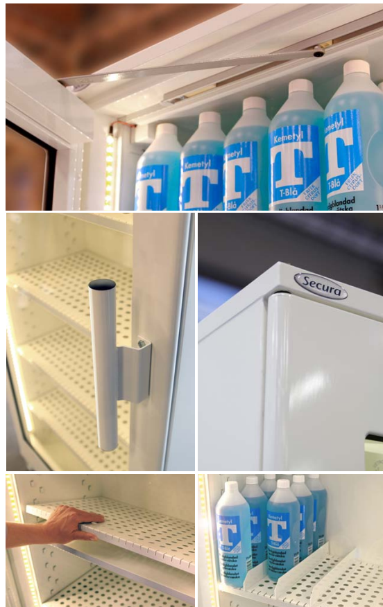
Bilderna visar ett skåp med tillvalen belysning, perforerade träghyllor samt avdelare.

Skåpen är testade och godkända i Klass 1 enligt SP 2369 och P-märkta av SP.