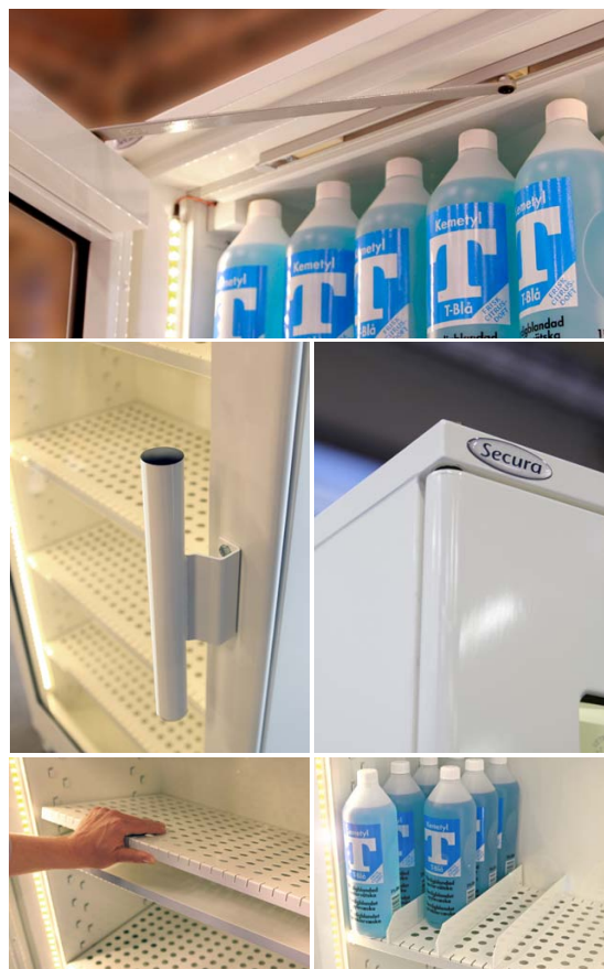
Bilderna visar ett skåp med tillvalen belysning, perforerade tråghyllor samt avdelare.

Skåpen är testade och godkända i Klass 1 enligt SP 2369 och P-märkta av SP.