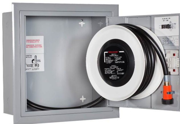
Bilden visar infällt skåp med 20 meter gummislang 19 mm, artikelnummer 19-5316-12

Skåpet är som standard vitt, men kan mot specialbeställning erhållas i annan färg