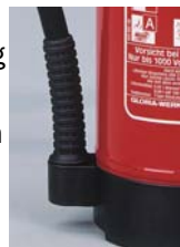
Plastfot med slangfäste

Vägghängare medföljer. Fordons- och fartygsstativ samt olika typer av skyddsskåp finns som tillbehör.