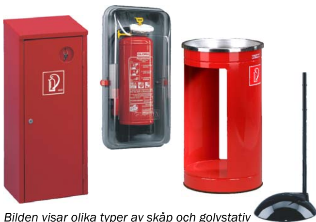
Bilden visar olika typer av skåp och golvstativ