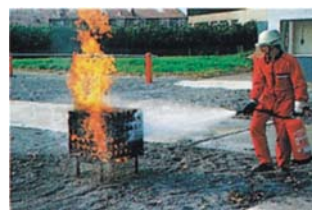
Släckning av provbål mot A-brand bestående av kub med korslagda trästavar

Insatsen kan också göras successivt med flera apparater utan att redan avsläckta områden återantänder.