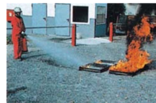
Provbål mot B-brand bestående av 4 st fyrfat med bensin/heptan