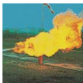
C - Gaser t.ex stadsgas, gasol

Släckarna kan användas mot elektrisk utrustning eftersom släckmedlet inte leder ström. Pulversläckarna är köldbästandiga och kan vara placerade utomhus även vintertid.