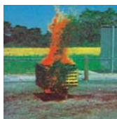
A - Fibrösa

Pulver är det mest mångsidiga släckmedlet och det släckmedel som har högst släckeffekt. Det ger ett utmärkt skydd vid varje slag av brandtillbud. Pulver är det enda släckmedel som är klassat för samtliga brandtyper: