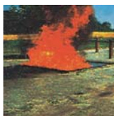
B - Vätskor och

material som trä, plaster som tyg och papper