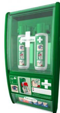
Cederroth ögonskölj-station inkl plåster nr 18-7025-15 OBS! Flaskor beställs separat