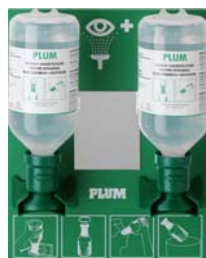
Plum ögonsköljstation 2 flaskor artikelnr 18-7025-02 1 flask + 1 flask PH-neutral nr 18-7025-07