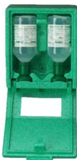
Plum ögonsköljskåp dammskyddat 18-7025-08 med uppvärmning 12 VDC 18-7025-09