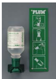
Plum 1 flask 18-7025-01

Ögonsköljflaskor uppfyller EUs direktiv för medicinska produkter och är märka med CE-märke och kontrollorganets sifferbeteckning.